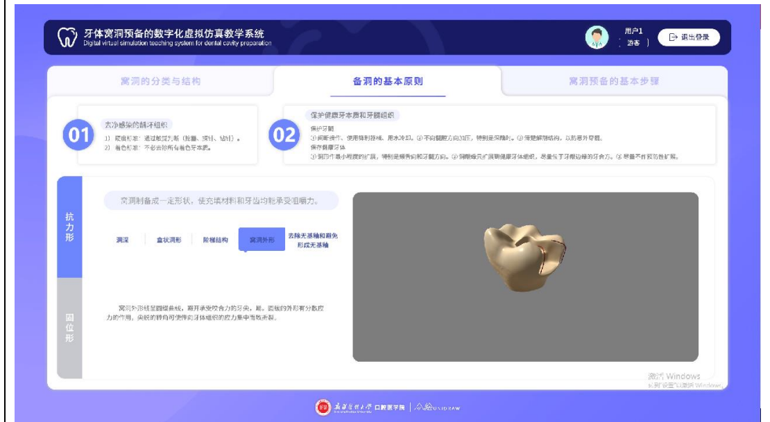
查看窝洞三维模型和文字说明，了解窝洞基本原则