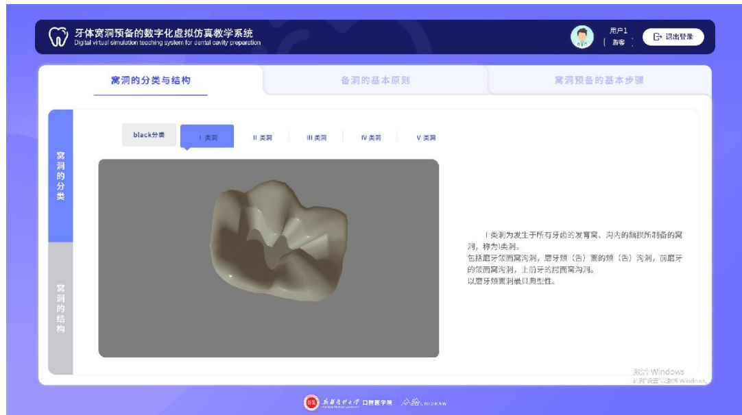
查看窝洞三维模型，了解窝洞分类和命名