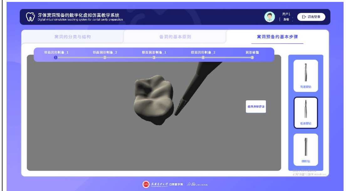
考核学生窝洞预备器械选择