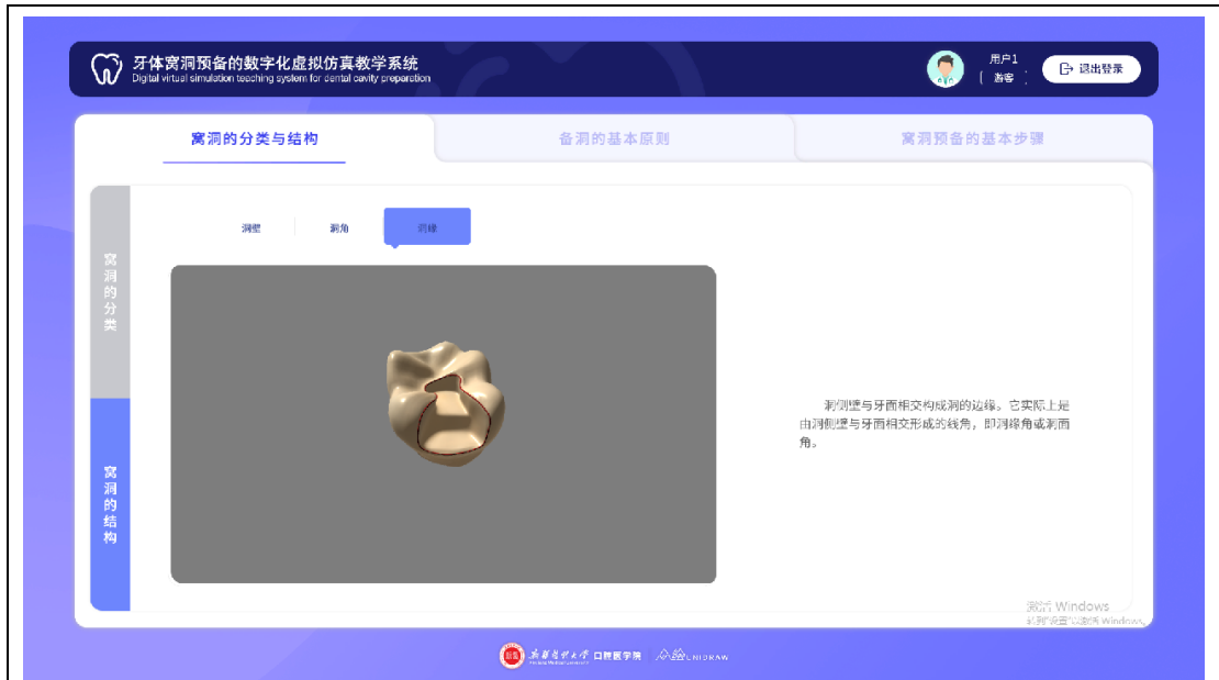
查看窝洞三维模型，了解窝洞结构