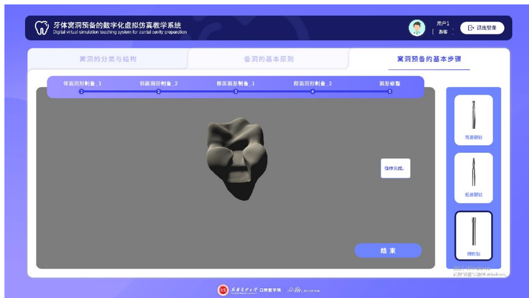
结束预备过程，查看窝洞预备结果