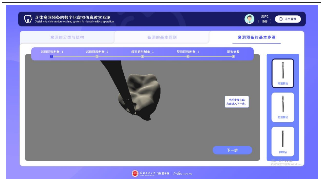
学生通过鼠标交互完成窝洞预备过程