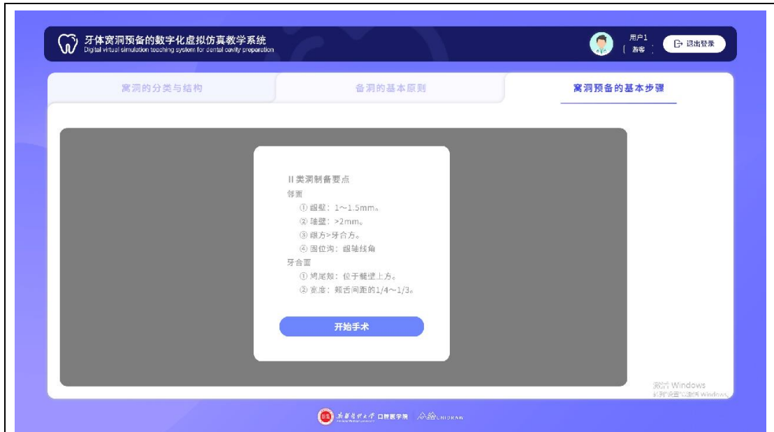
开始进行窝洞预备